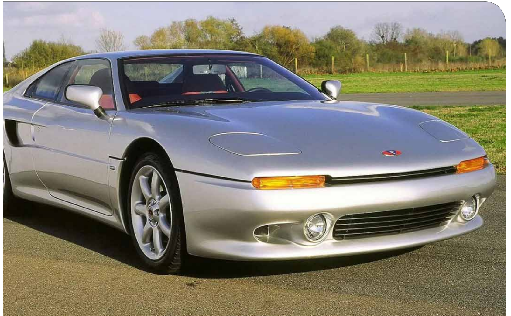
گروه خودرو editor@smtnews.ir